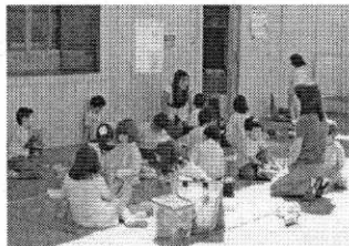
幼稚部 S J 校